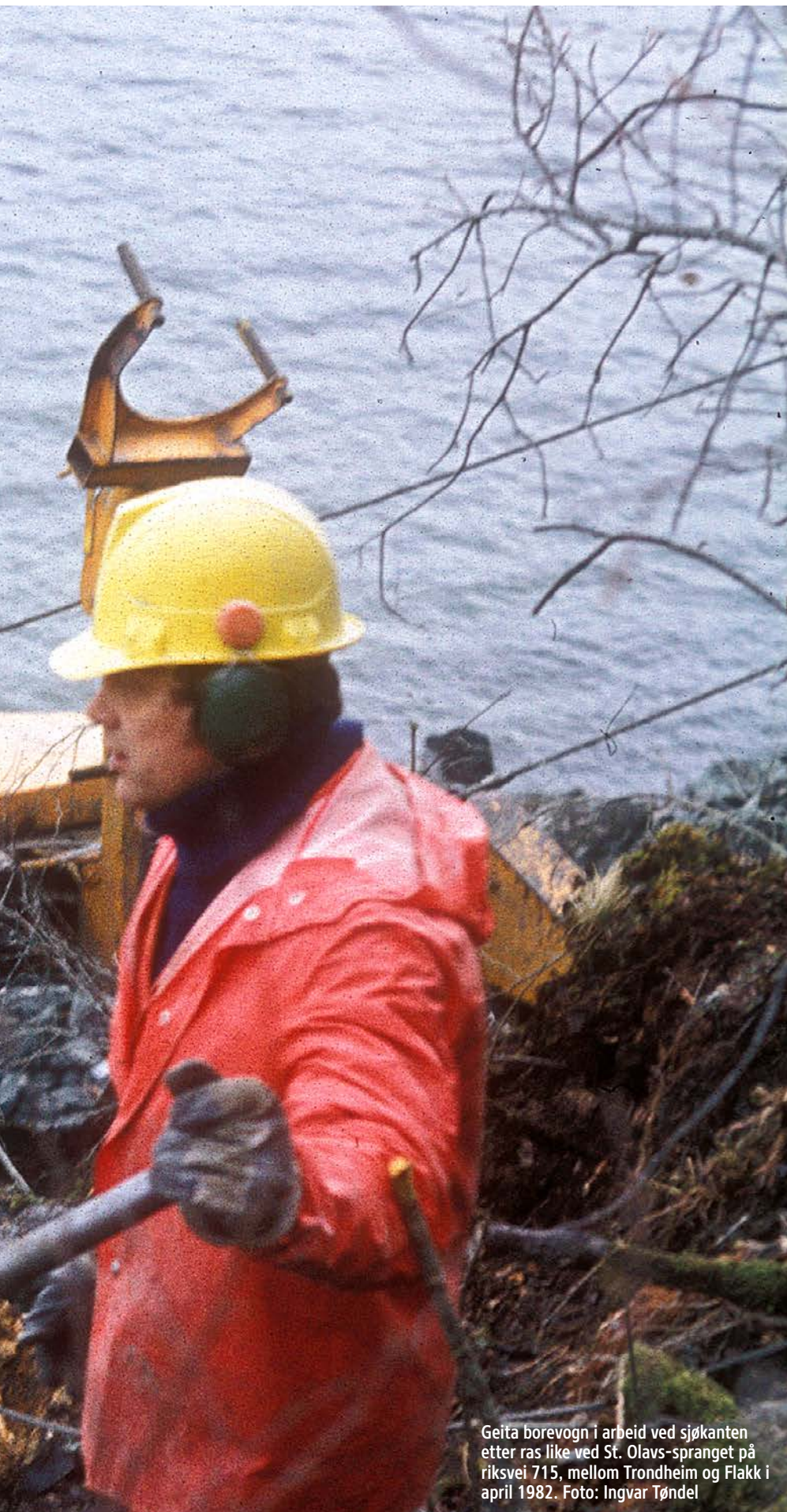
Geita borevogn i arbeid ved sjøkanten etter ras like ved St. Olavs-spranget på riksvei 715, mellom Trondheim og Flakk i april 1982.